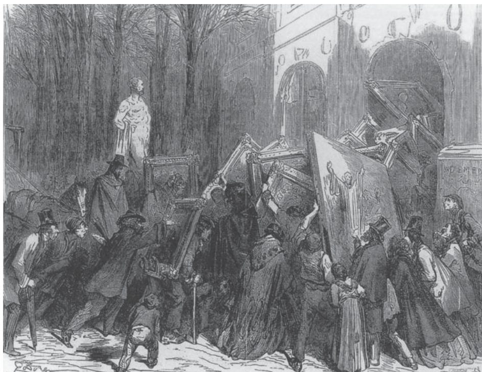
Gustave Doré (d'après) 31 de março: último dia de recepção das obras de arte para o salão de 1866.

O tom está dado. É o da retórica revolucionária. Se à de Balzac vocês preferirem a de Victor Hugo, liricamente apegada aos grandes pensadores do iluminismo, eis o que ele diz em Os miseráveis , em 1862: “Os enciclopedistas, Diderot à frente, os fisiocratas, Turgot à frente, os filósofos, Voltaire à frente, os utopistas, Rousseau à frente, formam as quatro legiões sagradas. O imenso avanço da humanidade em direção à luz lhes é devido. São as quatro vanguardas do gênero humano indo aos quatro